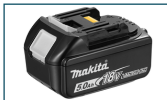
Accu BL1850 LXT 18V 5,0Ah (1 stuks) - 196671-0 - 0088381437967