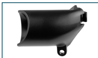
Stofzuigadapter cirkelzaag (1 stuks) - 199230-9 - 3240890496843