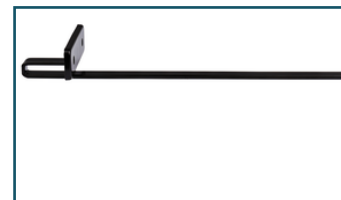
Parallelgeleider cirkelzaag (1 stuks) - 164095-8 - 0088381101080