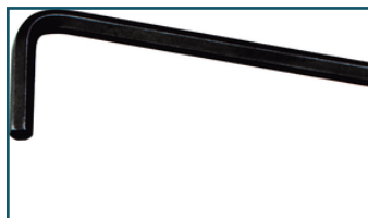
Inbussleutel 5,0 mm (1 stuks) - 783203-8 - 0088381102674