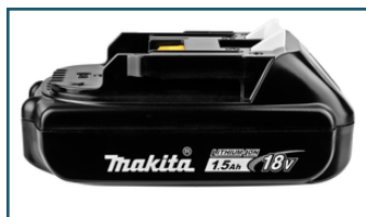
Accu BL1815N LXT 18V 1,5Ah (1 stuks) - 196235-0 - 0088381417556