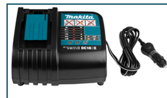
Auto oplader LXT DC18SE (1 stuks) - 194622-7 - 0088381349673

Dit is slechts een kleine greep uit het ruime assortiment. Kijk voor alle accessoires/verbruiksartikelen in de Catalogus of op www.makita.nl .