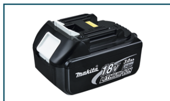
Accu BL1830 LXT 18V 3,0Ah (1 stuks) - 193533-3 - 0088381367004