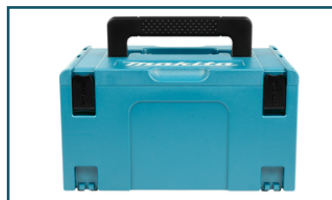
Mbox nr.3 (1 stuks) - 821551-8 - 0088381432993