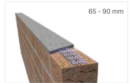
Murfor® Compact E-35