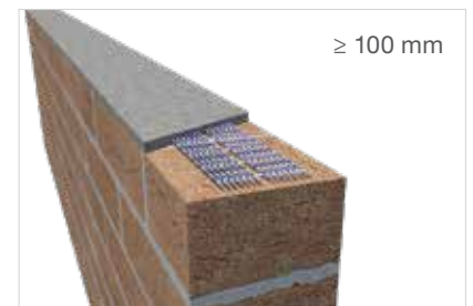
Murfor® Compact E-70