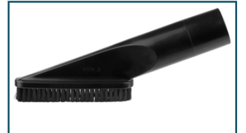
Borstelzuigmond zwart (1 stuks) - 198540-1 - 0088381484404

Dit is slechts een kleine greep uit het ruime assortiment. Kijk voor alle accessoires/verbruiksartikelen in de Catalogus of op www.makita.nl .