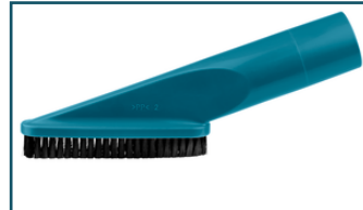
Borstelzuigmond blauw (1 stuks) - 198538-8 - 0088381484381