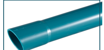
Zuigbuis blauw (1 stuks) - 459356-2 - 8720023009980