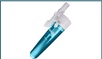
Cycloon voorafscheider wit (1 stuks) - 191D71-3 - 0088381556637