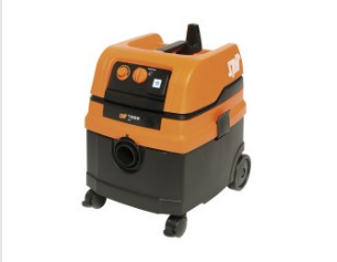
Artikel code 620912 AC1625 STOFZUIGER (25 LITER)