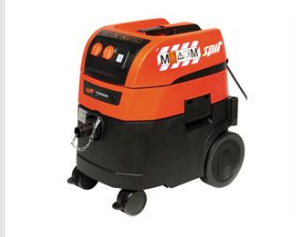
Artikel code 620914 AC1630P M STOFZUIGER (32 LITER)