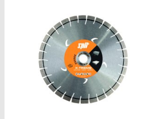
Artikel code 610063 XTREME CONCRETE DIAMANTBLAD D.150 / 22.2 MM - 2 ST