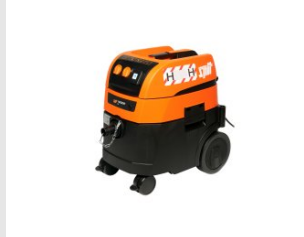
Artikel code 620920 AC1630P H STOFZUIGER (32 LITER)