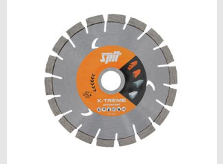
Artikel code 610197 XTREME UNIVERSAL DIAMANTBLAD D150 / 22.2 MM-2ST