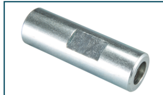
Menggarde adapter M14 (1 stuks) - 326649-1 - 8720023002318