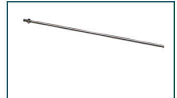
RVS mengsteel tbv mengbladen (1 stuks) - A-43751 - 0088381198769