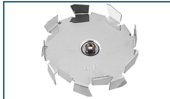
Mengblad 130mm RVS (1 stuks) - A-43670 - 0088381198684