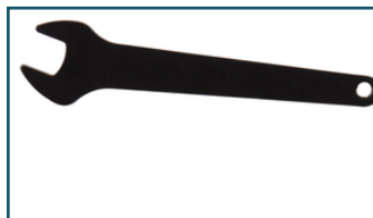
Steeksleutel 13mm (1 stuks) - 781006-4 - 0088381102407