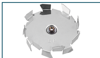
Mengblad 130mm RVS (1 stuks) - A-43670 - 0088381198684