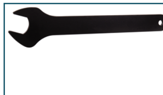
Steeksleutel 19mm (1 stuks) - 781010-3 - 0088381102421