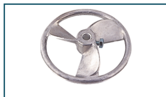
Mengblad 135mm aluminium (1 stuks) - A-43723 - 0088381198738