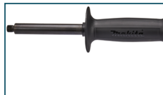
Zijhandgreep M12 (1 stuks) - 140G50-6 - 8720023002363