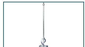
Menggarde 2-blads (1 stuks) - D-73508 - 0088381584869

Dit is slechts een kleine greep uit het ruime assortiment. Kijk voor alle accessoires/verbruiksartikelen in de Catalogus of op www.makita.nl .