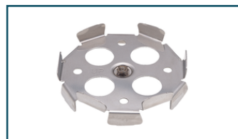
Mengblad 165mm RVS (1 stuks) - A-43692 - 0088381198707