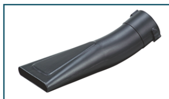
Vlakke blaasmond (1 stuks) - 456958-5 - 3240890467850

Dit is slechts een kleine greep uit het ruime assortiment. Kijk voor alle accessoires/verbruiksartikelen in de Catalogus of op www.makita.nl .