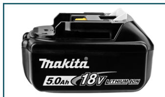
Accu BL1850B LXT 18V 5,0Ah (1 stuks) - 197280-8 - 0088381459129