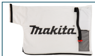
Bladzuigset (1 stuks) - 191E19-1 - *