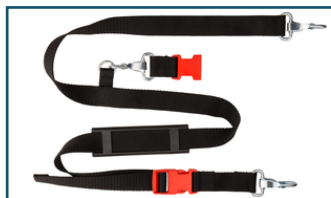
Draagriem (1 stuks) - 162698-2 - 8720023038294