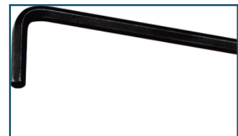
Inbussleutel 4,0 mm (1 stuks) - 783202-0 - 0088381102667