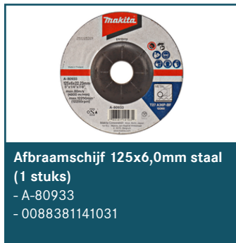
Afbraamschijf 125x6,0mm staal (1 stuks) - A-80933 - 0088381141031