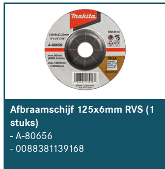
Afbraamschijf 125x6mm RVS (1 stuks) - A-80656 - 0088381139168