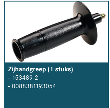
Zijhandgreep (1 stuks) - 153489-2 - 0088381193054