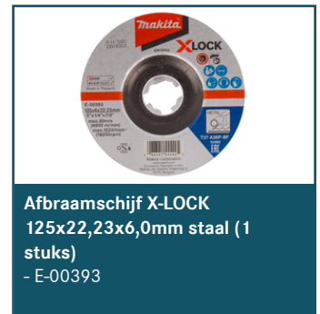
Afbraamschijf X-LOCK 125x22,23x6,0mm staal (1 stuks) - E-00393

Dit is slechts een kleine greep uit het ruime assortiment. Kijk voor alle accessoires/verbruiksartikelen in de Catalogus of op www.makita.nl .