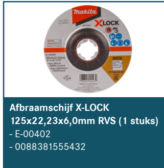
Afbraamschijf X-LOCK 125x22,23x6,0mm RVS (1 stuks) - E-00402 - 0088381555432