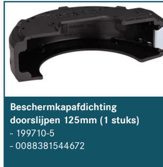
Beschermkapafdichting doorslijpen 125mm (1 stuks) - 199710-5 - 0088381544672