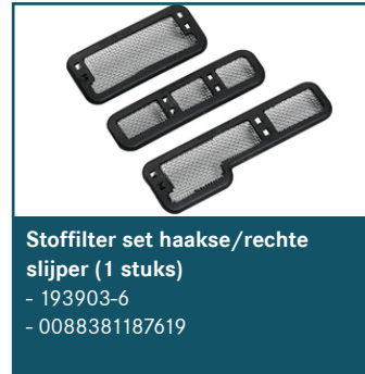
Stoffilter set haakse/rechte slijper (1 stuks) - 193903-6 - 0088381187619