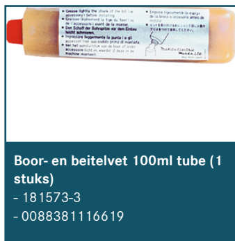
Boor- en beetelvet 100ml tube (1 stuks) - 181573-3 - 0088381116619