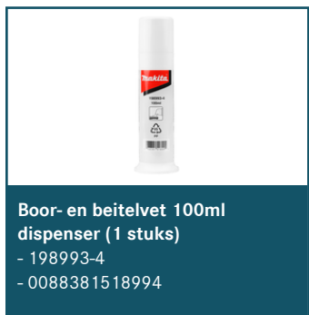
Boor- en beetelvet 100ml dispenser (1 stuks) - 198993-4 - 0088381518994