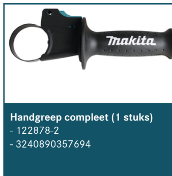
Handgreep compleet (1 stuks) - 122878-2 - 3240890357694