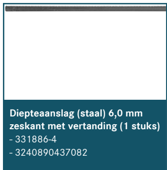
Diepteanslag (staal) 6,0 mm zeskant met vertanding (1 stuks) - 331886-4 - 3240890437082