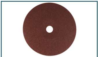
Schuurschijf 180mm K120 Red (1 stuks) - P-01105 - 0088381918947