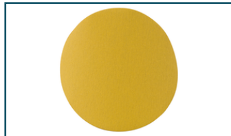
Schuurschijf 180mm K120 Yellow Velcro (1 stuks) - P-33451 - 0088381961615