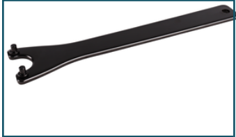
Nokkensleutel 35 mm (1 stuks) - 197610-3 - 0088381519007