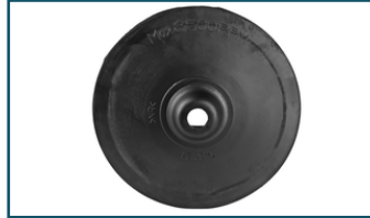
Rubber steunschijf 170mm (1 stuks) - 743012-7 - 0088381101233