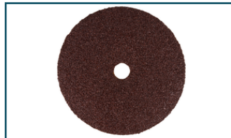
Schuurschijf 180mm K24 Red (1 stuks) - P-01030 - 0088381918879