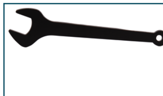
Steeksleutel 17mm (1 stuks)

- 781008-0 - Goingsprijs € 3,00 - 0088381102414