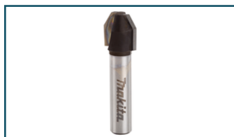
Afkantfrees 30gr S8 (1 stuks)

- D-10659 - Goingsprijs € 20,00 - 0088381165693