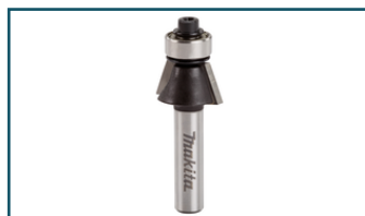
Afkantfrees+lag 22gr S8 (1 stuks)

- D-10665 - Goingsprijs € 20,00 - 0088381165709