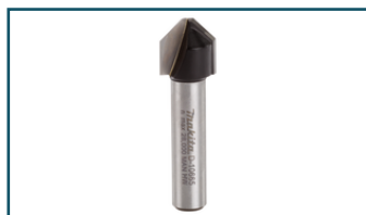
Afkantfrees 45gr S8 (1 stuks)

- D-10659 - Goingsprijs € 20,00 - 0088381165693