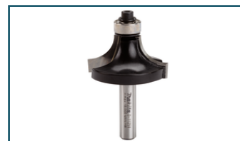
Afrondfrees+lag R12,7 S8 (1 stuks)