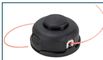
Maaikop 2x2,4mm T+G M10x1,25LH (1 stuks) - 197993-1 - Goingsprijs € 15,50