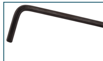
Inbussleutel 4,0mm (1 stuks) - 783202-0 - Goingsprijs € 1,75 - 0088381102667