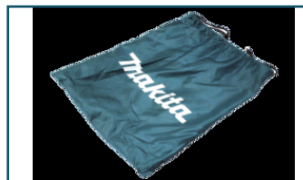
Gereedschapszak (1 stuks) - 831304-7 - Goingsprijs € 5,00 - 0088381361484