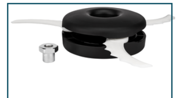
Maaikop 255mm kunststof messen (1 stuks) - 126642-3 - Goingsprijs € 21,00