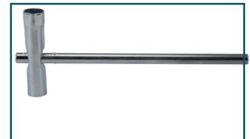
Dopsleutel 17mm (1 stuks) - 782238-6 - Goingsprijs € 3,50 - 8720023015349