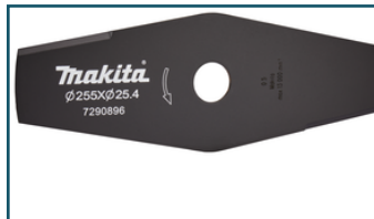
Snijblad 255x25,4x2,0mm 2-tands (1 stuks) - 198345-9 - Goingsprijs € 9,50