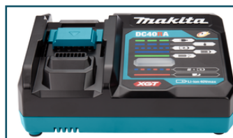
Snellader XGT DC40RA (1 stuks) - 191E07-8 - Goingsprijs € 105,00 - 0088381556354