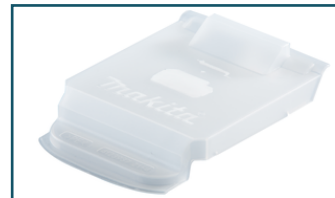
Afdekkap XGT accu's (1 stuks) - 412393-7 - Goingsprijs € 2,00 - 8720023036368