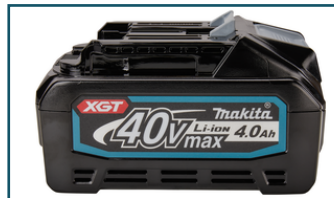
Accu BL4040 XGT 40V Max 4,0Ah (1 stuks) - 191B26-6 - Goingsprijs € 175,00