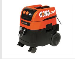
Artikel code 620914 AC1630P M STOFZUIGER (32 LITER)