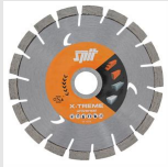
XTREME UNIVERSAL Diamantblad voor universeel gebruik