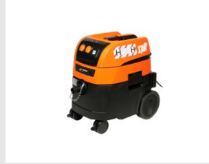
Artikel code 620920 AC1630P H STOFZUIGER (32 LITER)