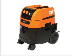
Artikel code 620913 AC1630P STOFZUIGER (32 LITER)