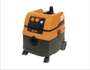
Artikel code 620912 AC1625 STOFZUIGER (25 LITER)