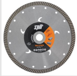
SILVER TURBO-T DIAMANTSCHIJF