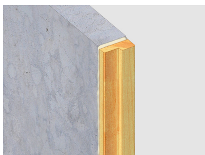
Massieve muur- houten kozijnaansluiting Voegbreedte 10 mm Massieve steenachtige wand 100 mm Houten kozijn 100 mm x 42 mm