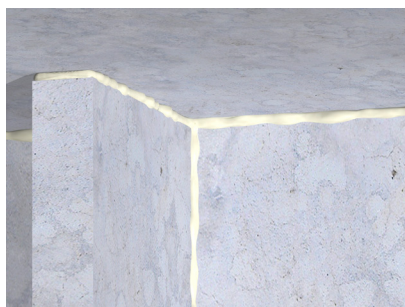
Massieve vloer- muuraansluiting (horizontaal) Ook geschikt voor schachtwanden