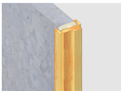
Massieve muur- houten kozijnaansluiting Voegbreedte 30 mm Massieve steenachtige wand 100 mm Houten kozijn 100 mm x 42 mm Voeg aan 2 kanten afgewerkt met aftimmerlat 15 mm dik, 50 mm breed

FF197 Brandwerend Schuim kan ook worden toegepast als brandwerende voegafdichting rondom HSB elementen met betonnen wand- en of vloeraansluitingen. Hierbij mag de voeg niet breder zijn dan 10 mm.