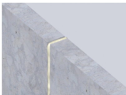
Massieve muur- muuraansluiting (verticaal) Muurdikte volledig gevuld