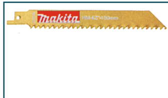
Reciprozaagb 130 HM S64 1HM (1 stuks) - P-05044 - 0088381914192