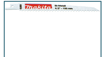
Reciprozaagb 130 hout S61 1DF (9 stuks) - P-05088 - 0088381914314

Dit is slechts een kleine greep uit het ruime assortiment. Kijk voor alle accessoires/verbruiksartikelen in de Catalogus of op www.makita.nl .