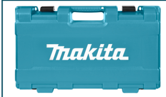
Koffer (1 stuks) - 824734-9 - 0088381200257