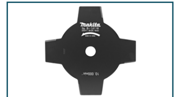
Snijblad 230x25,4x1,8mm 4T (1 stuks) - B-14118 - 0088381361064

Dit is slechts een kleine greep uit het ruime assortiment. Kijk voor alle accessoires/verbruiksartikelen in de Catalogus of op www.makita.nl .