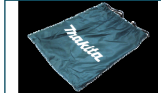
Gereedschapszak (1 stuks) - 831304-7 - 0088381361484