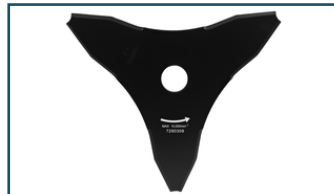
Slagmes 230x25,4x3,0mm 3T (1 stuks) - 195298-3 - 0088381364928