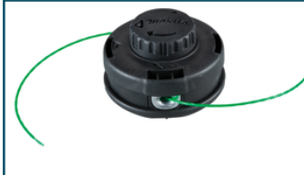
Draadkop 2x2,0mm T+G M10x1,25lh (1 stuks) - 191D89-4 - 0088381559270