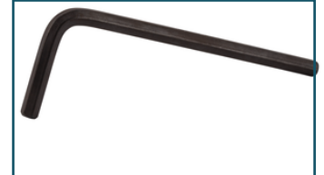
Inbussleutel 4,0 mm (1 stuks) - 783202-0 - 0088381102667