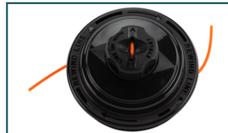
Snelvul draadkop T&G M10x1,25LH (1 stuks) - T-01753A - 0088381242493