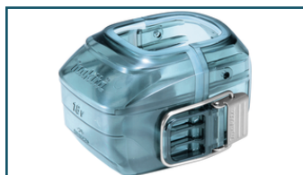
18V Stof/water beschermkap (1 stuks)