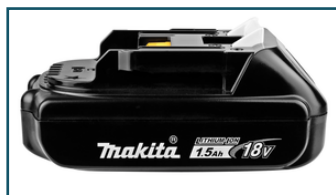
Accu BL1815N LXT 18V 1,5Ah (1 stuks)