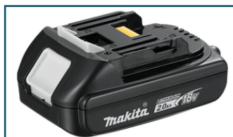
Accu BL1820 LXT 18V 2,0Ah (1 stuks)