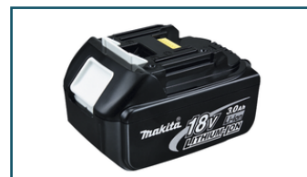
Accu BL1830 LXT 18V 3,0Ah (1 stuks)