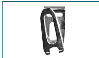
Draaghaak lang (1 stuks)