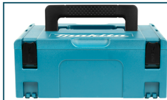
Mbox nr.2 (1 stuks)