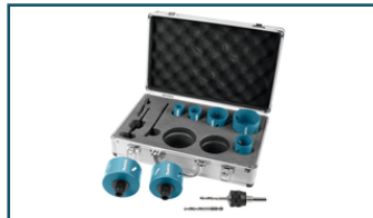
Gatzaagset 10-dlg bl. E-inst. (6 stuks) - B-18188 - 0088381372329