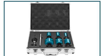
Gatzaagset 8-dlg bl. L-inst. (6 stuks) - B-11966 - 0088381353694

Dit is slechts een kleine greep uit het ruime assortiment. Kijk voor alle accessoires/verbruiksartikelen in de Catalogus of op www.makita.nl .