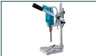
Boorstandaard Euronorm 43 (1 stuks) - A-36712 - 0088381183154