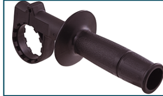
Handgreep compleet (1 stuks) - 135302-6 - 3240890306265