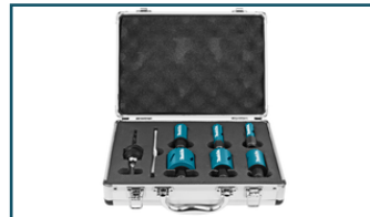
Gatzaagset 8-dlg bl. E-inst. (6 stuks) - B-11972 - 0088381353700