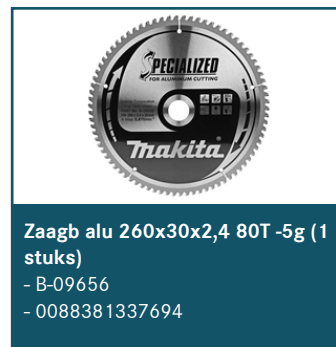
Zaagb alu 260x30x2,4 80T -5g (1 stuks)