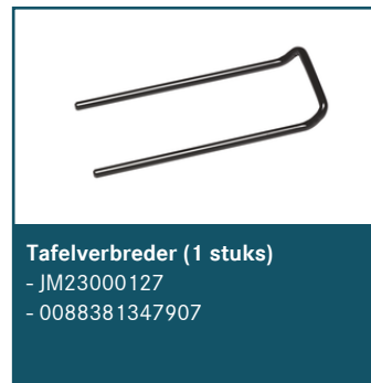
Tafelverbreder (1 stuks)