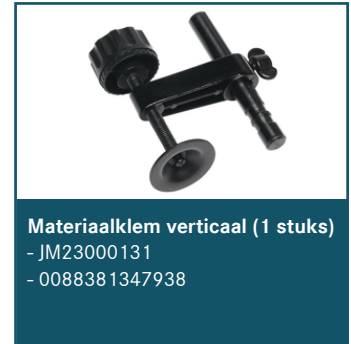
Materiaalklem verticaal (1 stuks)