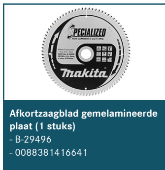
Afkortzaagblad gemelamineerde plaat (1 stuks)