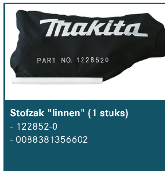
Stofzak "linnen" (1 stuks)