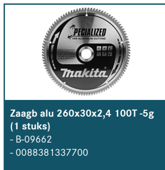
Zaagb alu 260x30x2,4 100T -5g (1 stuks)