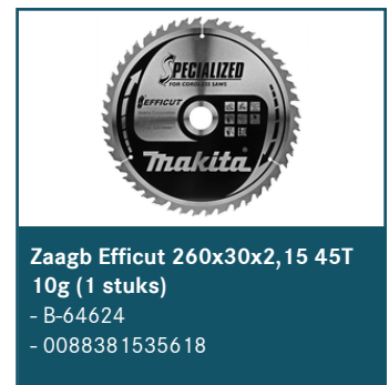
Zaagb Efficut 260x30x2,15 45T 10g (1 stuks)