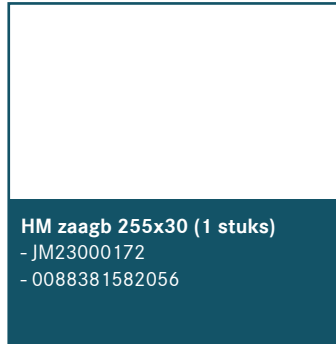
HM zaagb 255x30 (1 stuks)