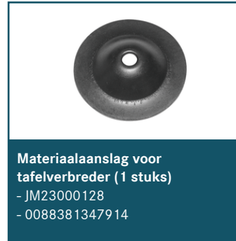
Materiaalaanslag voor tafelverbreder (1 stuks)