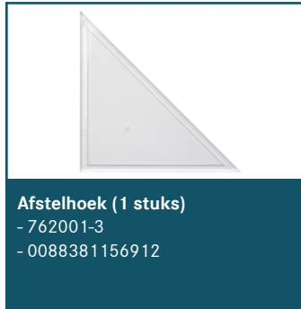
Afstelhoek (1 stuks)