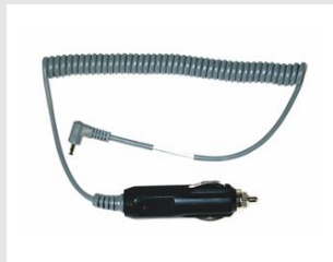
Artikel code 900507 CAR ADAPTER 12V - PULSA / IMPULSE