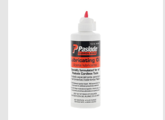
Artikel code 401482 IMPULSE OLIE