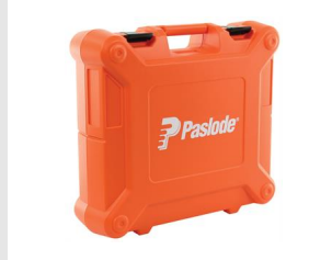
Artikel code 014979 KOFFER IM65 / IM65A / IM50 LITHIUM