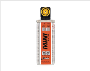
Artikel code 300341 GASPATROON (2X) - GEEL IM50 / IM65