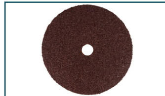
Schuurschijf 180mm K24 Red (1 stuks) - P-01030 - 0088381918879