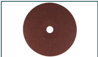
Schuurschijf 180mm K120 Red (1 stuks) - P-01105 - 0088381918947