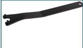
Nokkensleutel gebogen 28 mm (1 stuks) - 782412-6 - 0088381102629