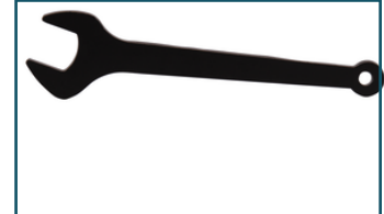
Steeksleutel 17mm (1 stuks) - 781008-0 - 0088381102414