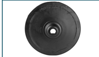
Rubber steenschijf 170mm (1 stuks) - 743012-7 - 0088381101233