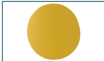
Schuurschijf 180mm K120 Yellow Velcro (1 stuks) - P-33451 - 0088381961615