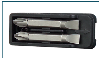
Bithouder (1 stuks)