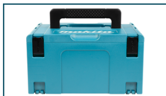
Mbox nr.3 (1 stuks)