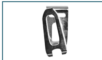
Draaghaak lang (1 stuks)