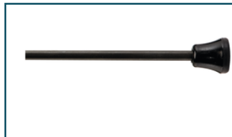
Diepteanslag boormachine (1 stuks)