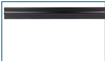
Transportbescherming 52cm (1 stuks)