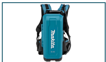
18 V ruggedragen accustation PDC01 (1 stuks)