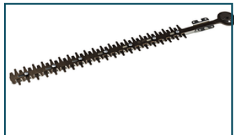
Schaarmessenset 52 cm (1 stuks)