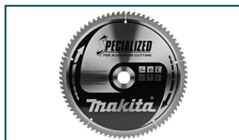
Zaagb alu 305x30x2,4 80T -5g (1 stuks)