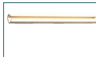
Sluitstrip voor linnen stofzak (1 stuks)