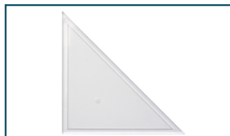
Afstelhoek (1 stuks)