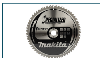
Zaagb Efficut 305x30x2,15 60T 10g (1 stuks)