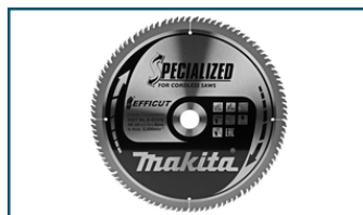
Zaagb Efficut 305x30x2,15 100T 10g (1 stuks)