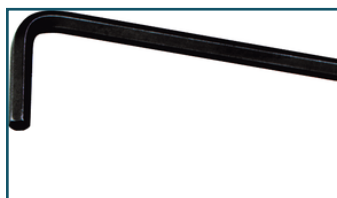
Inbussleutel 2,5 mm (1 stuks)