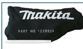
Stofzak "linnen" (1 stuks)