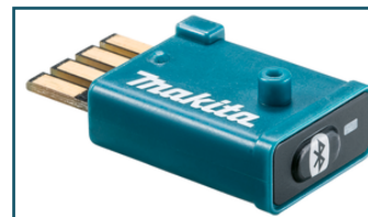
AWS zender WUT01 (1 stuks)