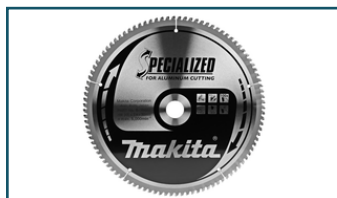
Zaagb alu 305x30x2,4 100T -5g (1 stuks)