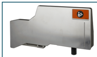
Aanslag boven rechts (1 stuks)