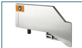
Aanslag boven links (1 stuks)