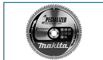
Zaagb Efficut 305x30x2,15 80T 10g (1 stuks)