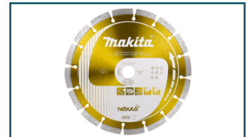
Diamantschijf 230x22,23x2,4mm oranje (1 stuks) - B-54025

Dit is slechts een kleine greep uit het ruime assortiment. Kijk voor alle accessoires/verbruiksartikelen in de Catalogus of op www.makita.nl .