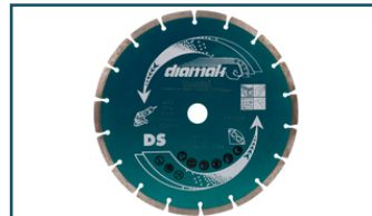
Diamantschijf 230x22,23x2,4mm (1 stuks) - D-61145 - 0088381475792