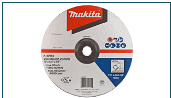
Afbraamschijf 230x6,0mm staal (1 stuks) - A-80955 - 0088381141055