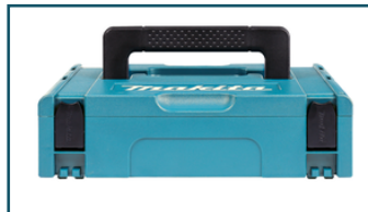
Mbox nr.1 (1 stuks) - 821549-5 - 0088381432986