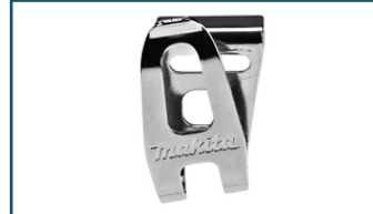
Draaghaak kort (1 stuks) - 346909-5 - 3240890437426