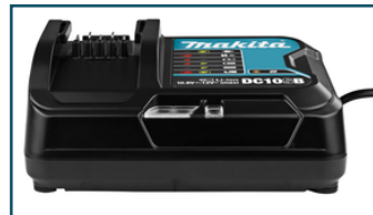
Oplader CXT DC10SB 12 V Max (1 stuks) - 197363-4 - 0088381459563