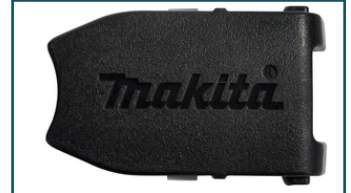
Koffer sluiting Mbox (Zwart) (1 stuks) - 453974-8 - 0088381430135