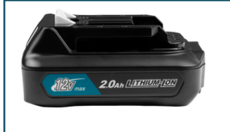
Accu BL 1021B CXT 12V Max 2,0 Ah (1 stuks) - 197396-9 - 0088381459839