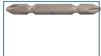
Schroefbit dubbel PH2x65 (1 stuks) - 798309-9 - 0088381107778

Dit is slechts een kleine greep uit het ruime assortiment. Kijk voor alle accessoires/verbruiksartikelen in de Catalogus of op www.makita.nl .