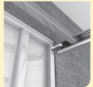
afb. 2: stalen kanteldeur