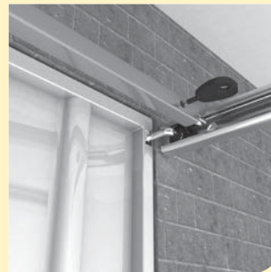
afb. 1: stalen kanteldeur