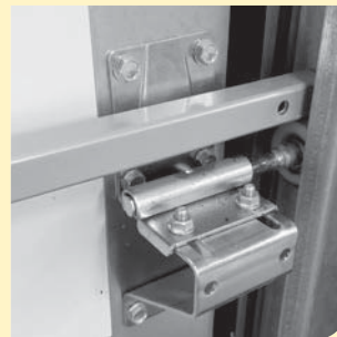
afb. 3: toepassing bij een sectionaal deur