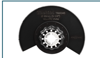
TMA045 Segmentzaagblad 85mm hout&staal (1 stuks)