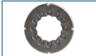
Adapter Multitool (1 stuks)