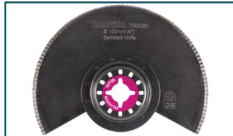
TMA020 Segmentmes 100mm (1 stuks)